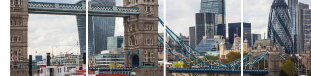
Kaufmännische Weiterbildung – Beschaffung/Absatz und Marketing