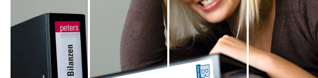
Kaufmännische Weiterbildung – Fachkraft für Finanzbuchhaltung