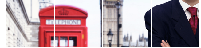
Kaufmännische Weiterbildung – Wirtschaftsenglisch